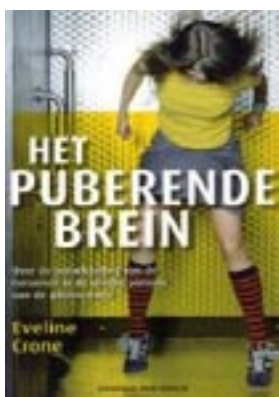
Puberende brein Eveline Crone