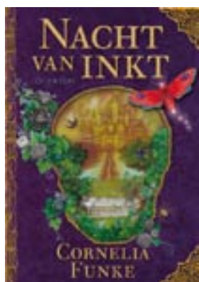
Nacht van Inkt Funke