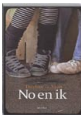
No en ik de Vigan