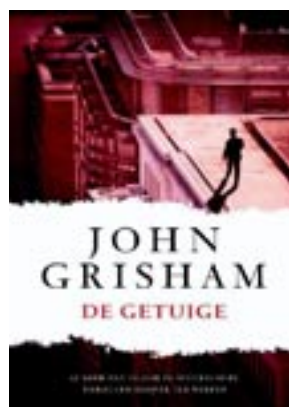
De getuige Grisham