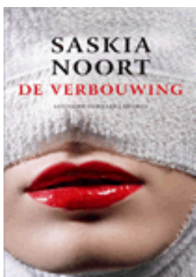
De Verbouwing Saskia Noort