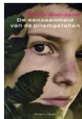
Eenzaamheid van priemgetallen Paolo Giordano