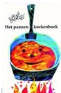
Het pannenkoekenboek Eric Carle

Deze maand van 7 tot 17 oktober kinderboekenweek!