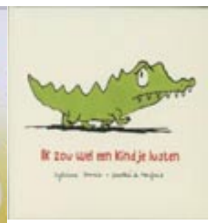
Ik zou wel een kindje lusten Sylviane Donnio