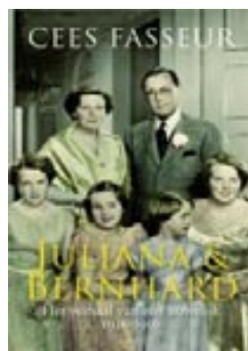
Juliana en Bernhard Cees Fasseur