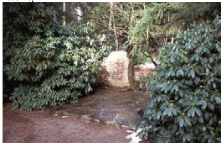
Het graf van Gerrit Achterberg

Voorbij de laatste stad, bloemlezing (met een inleiding van Paul Rodenko)