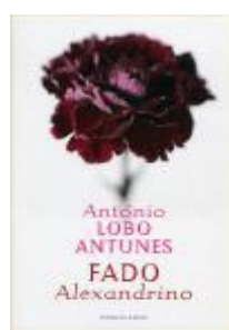
António Lobo Antunes Fado Alexandrino