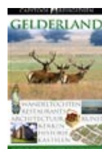
Wouter Christiaens Capitool Reisgids Gelderland